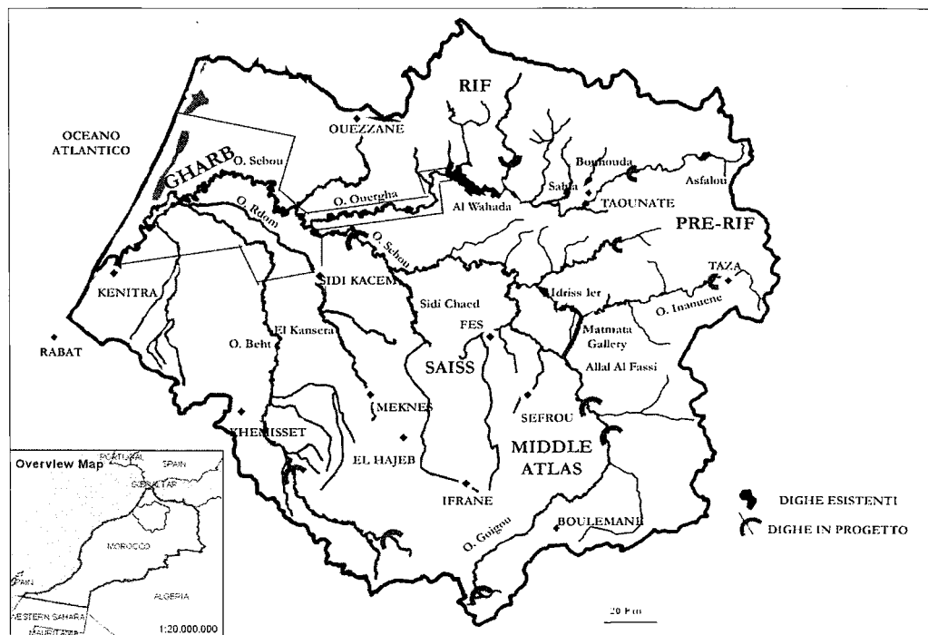
Fig. 1 – Il bacino del Sebou (Marocco)

Nel Medio Atlante si è riscontrato un forte paradosso: da una parte, infatti, questa è una delle zone del bacino del Sebou, e del Marocco nel suo complesso, più ricca d'acqua; dall'altra, l'area è caratterizzata da una situazione di forte arretratezza, con un'economia basata su allevamento e agricoltura di sussistenza, praticata solo in minima parte con irrigazione e con rendite molto basse. La disponibilità idrica ha cioè influito in modo limitato sull'economia locale e, anzi, il progetto ha destrutturato la territorialità basica (Turco, 1988). A fronte di un ingente investimento determinato dalla costruzione della diga Allal Al Fassi, le acque mobilizzate non sono state rese disponibili localmente, rendendo necessaria l'apertura di pozzi e causando un sovrasfruttamento della falda, con impatti negativi sulle sorgenti e sulle aree umide. L'area, quindi, si caratterizza come tipicamente periferica (Reynaud, 1988); non ha beneficiato della politica delle dighe, ma ha solo subito impatti negativi. Questo mette in evidenza il sostanziale fallimento di tale politica nell'obiettivo di riequilibrare le situazioni di sviluppo regionale.